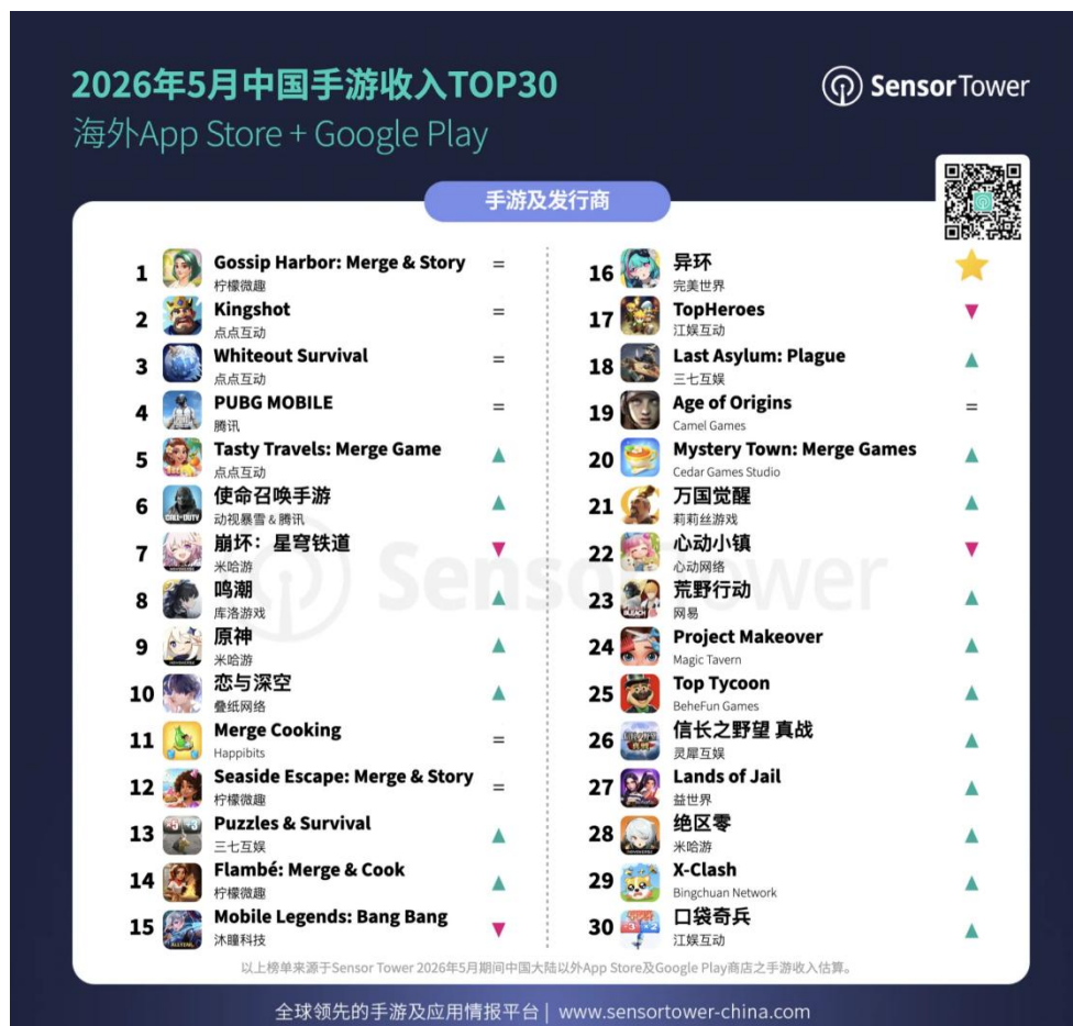
图3: 2026 年 5 月中国手游收入 TOP30 | 海外 AppStore+GooglePlay

根据 SensorTower 数据,2026 年 5 月中国手游收入前三名分别为柠檬微趣《Gossip Harbor: Merge&Story》、点点互动《Kingshot》和点点互动《Whiteout Survival》。